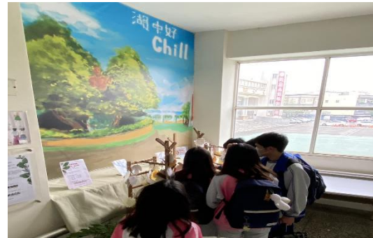
畢業季結合勞權知能角落活動