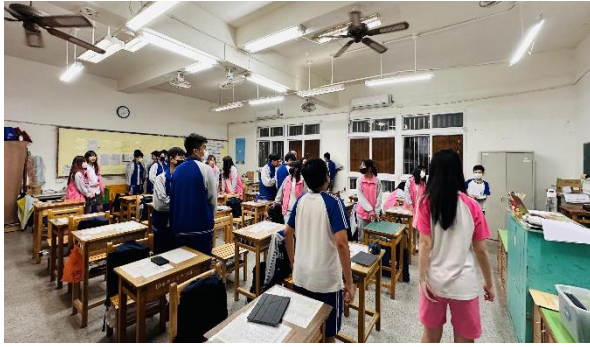
咱兜个島到他兜个島分組討論指出地圖