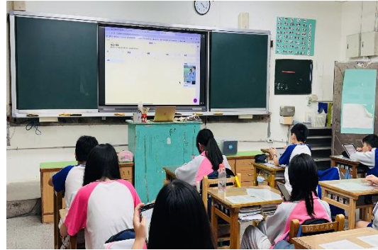
詐騙資訊各組尋找