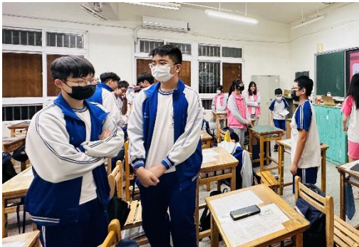
「平原地形與海岸線」對於人口流動與邊境管控討論