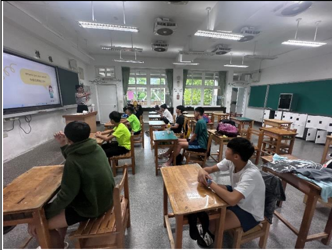
教師引導學生思考打工可能遇到的問題