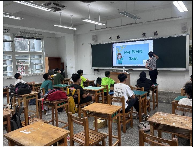
教師引導學生思考打工可能遇到的 問題