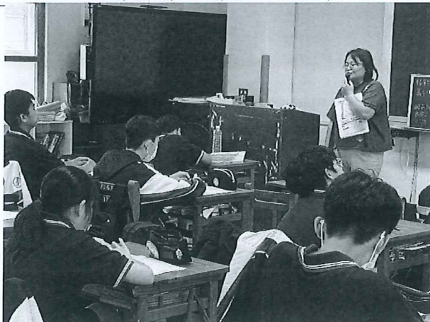
討論基本的休息與工資保障