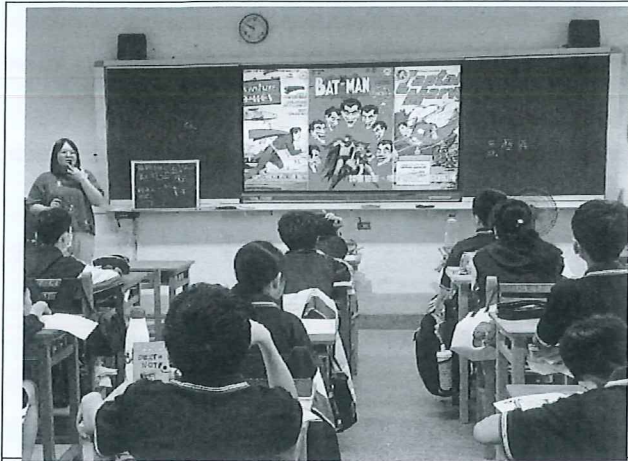
認識風格與下指令方式