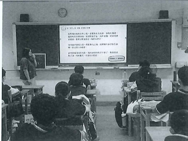
講解勞工權益的故事