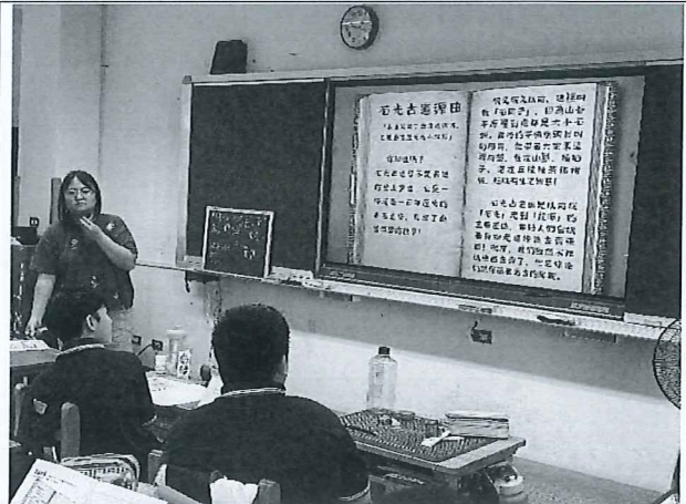
講解石光古道故事