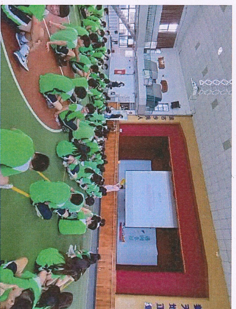
說明：同學認真聽講