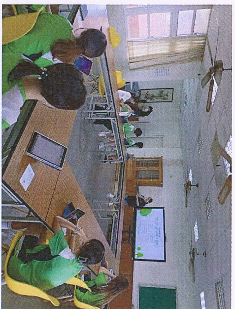
說明：小團體性向測驗