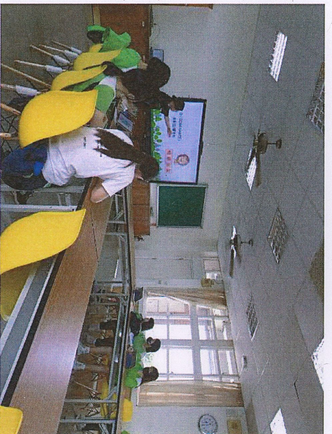
說明：性向測驗結果解說