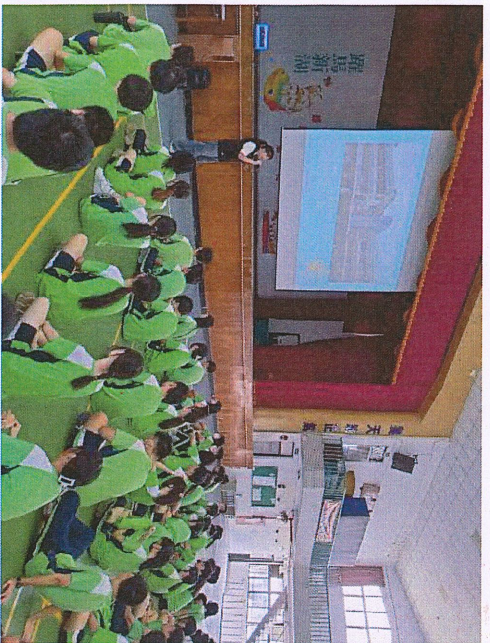
說明：介紹新竹市賈桃樂職業學習中心