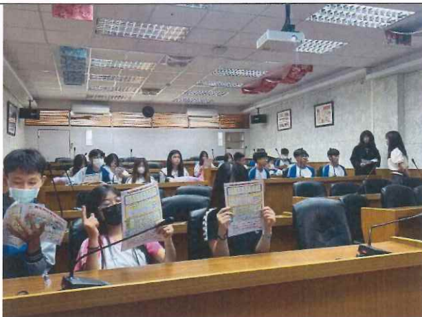
說明：Q&A 時間讓學生提出相關疑問