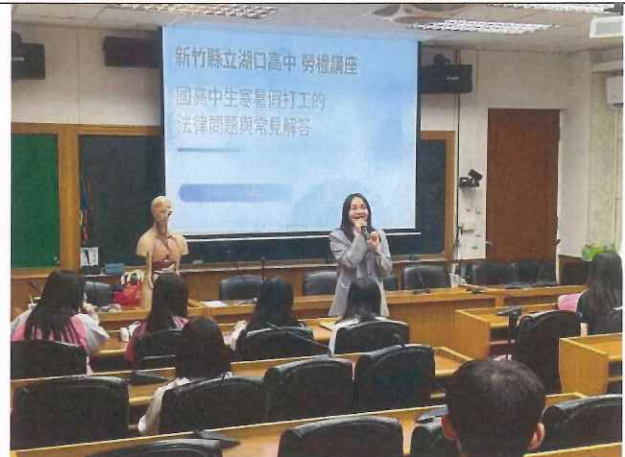
說明：解析《勞基法》等加強學生相關法律概念